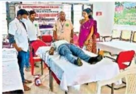
రక్తదానం చేస్తున్న విద్యార్థి