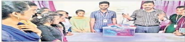
శిక్షణ పొందుతున్న యువత

అక్వీరియం చేపల పెంపకంపై శిక్షణ రూ.2 లక్షల పెట్టుబడితో వ్యాపారం చేసేందుకు అవకాశం కందుకూరు చేపల అక్వీరియం రంపచోడవరం: గిరిజన యువతకు ఉపాధి అవకాశాలు కల్పించేందుకు పందిరిమామిడి వృద్ధి విజ్ఞాన కేంద్రం ఏకేషన్ వృద్ధి చేస్తోంది. ఆర్థికంగా బలోపేతం చేసేందుకు అవసరమైన అనేక శిక్షణ ఇస్తున్నారు. కేంద్రం ద్వారా చేపలేగుల పెంపకం, ఇతర మత్స్య పెంపకం, మిక్సిడ్ విద్యుత్తు తయారీ, పవనతో విలపన అధారిత ఉత్పత్తులు, చేపలతో వర్చువల్ కయారీ వంటి అనేక అంశాల్లో శిక్షణ ఇస్తోంది. తాజాగా 30 మంది యువతకు అక్వీరియం తయారీ, చేపల పెంపకం, ఉత్పత్తిపై వరుస రోజులపాటు శిక్షణ పూర్తయింది. గృహోపకరణాల్లో భాగం అక్వీరియం ఇంట్లో ఉత్పత్తిని అందజేయడానికి అవకాశం ఉంది. ఇటీవలే కాలంలో వాస్తవ ప్రకారం అక్వీరియం లను ఇతర వర్గాలు చేసుకుంటున్నారని, దీంతో అక్వీరియం మార్కెట్లో డిమాండ్ ఉంది. ఈ నేపథ్యంలో అక్వీరియం ద్వారా చేపల పెంపకం, ఉత్పత్తిపై ప్రాధాన్యత సంతరించుకుంది. ఈ మేరకు వృద్ధి